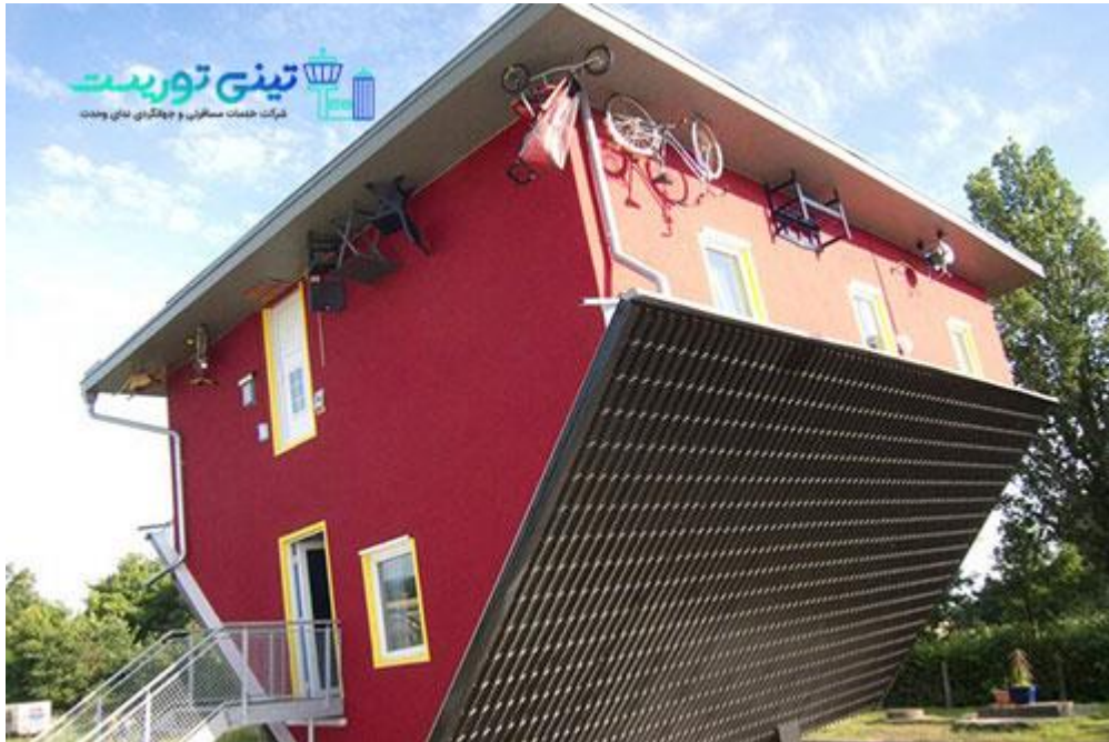
خانه وارونه مکلنبورگ فورپومرن در کشور آلمان

کسانی که به دنبال اخذ ویزا شنگن کشور آلمان هستند قطعاً به فکر تجربه قطار معلق "ووپرتال" هستند. دو قطار معلق مشهور در دنیا که تجربه آن نیاز به کمی جرات دارد.