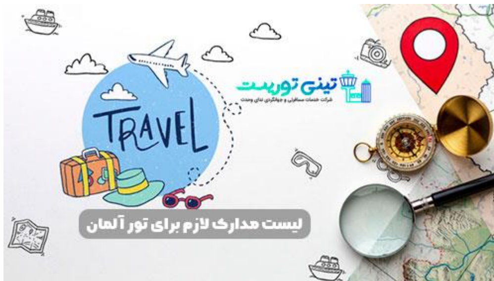
لیست مدارک لازم تور آلمان