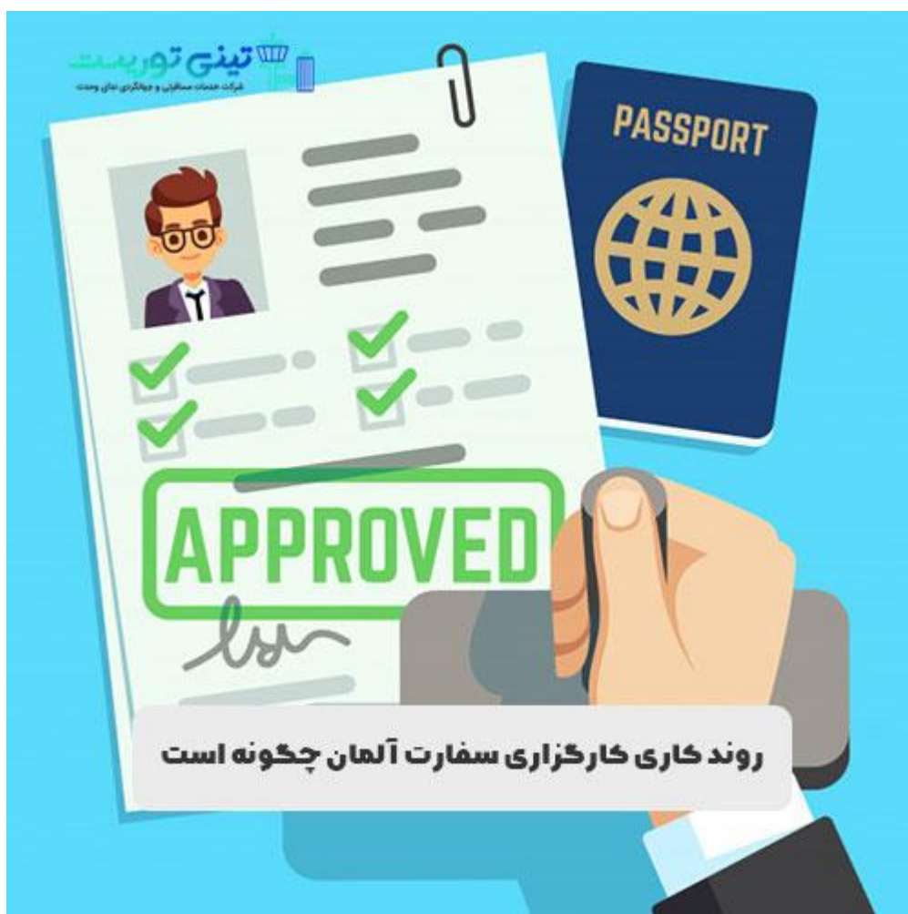
روند کاری سفارت آلمان

یک نکته مهم اینکه استفاده از خدمات VIP کارگزاری به معنی تعیین وقت سفارت فوری نخواهد بود و هیچ ارتباطی به بررسی سریع تر به پرونده متقاضی ندارد.