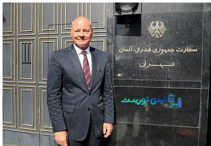
خدمات سفارت آلمان در تهران