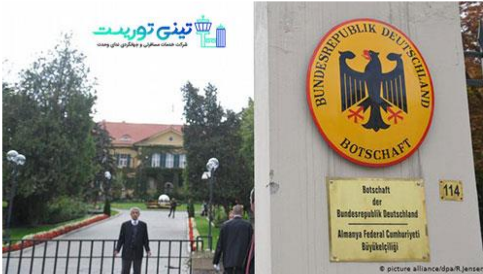
عکس سفارت آلمان

می توانید از طریق شماره تلفن های زیر در روزهای یکشنبه الی پنجشنبه در ساعت ۱۱ الی ۱۲ ظهر از طریق خط ویژه سوالات خود را بپرسید که برای اخذ ویزا نیاز است به همه موارد گفته شده دقت شود.