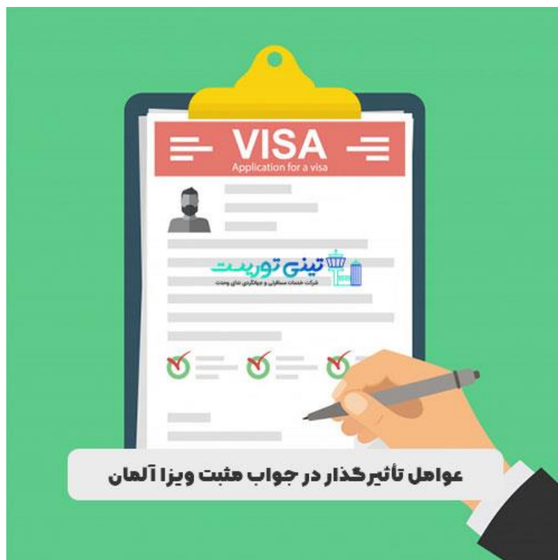
جواب مثبت ویزا آلمان

ویزا نوع D شینگن نیز وجود دارد که در قالب چند بار ورود است و برای دانشجویان بین المللی، دانشجویان خارجی متقاضی پروژه های تحقیقاتی، افراد متخصص و موارد اضطراری صادر می شود.