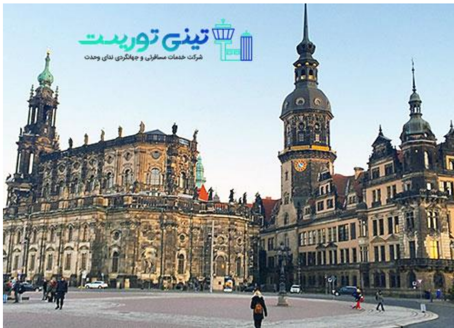
شهر درسدن آلمان

حتماً به گوش شما هم رسیده است که در آلمان از حرکت باران موسیقی می سازند! ساختمان مشهور در شهر "درسدن" در آلمان به صورتی طراحی شده است که با حرکت باران بر روی آن موسیقی دل انگیزی شنیده می شود.