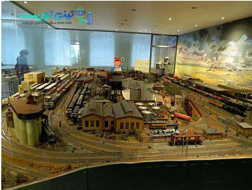
موزه اسباب بازی نورنبرگ کشور آلمان

برای اخذ ویزای شینگن کشور آلمان به صورت خانوادگی با هدف توریستی سری به موزه اسباب بازی نورنبرگ بزنید و کودکان خود را شگفت زده کنید. قلعه گردی در آلمان را فراموش نکنید. از یاد نبرید که این کشور توانسته همه سلیقه های دنیا را پوشش دهد؛