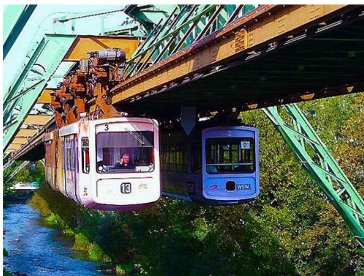
قطار معلق ووپرتال در کشور آلمان

کسانی که به دنبال اخذ ویزا شنگن کشور آلمان هستند قطعاً به فکر تجربه قطار معلق "ووپرتال" هستند. دو قطار معلق مشهور در دنیا که تجربه آن نیاز به کمی جرات دارد.